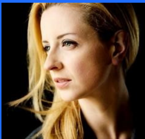
LAURA WADE - autrice

Dopo la laurea in teatro all'Università di Bristol, Laura Wade entra nel programma per giovani drammaturghi del Royal Court Theatre e la sua prima opera, Limbo , debutta al Crucible Theater di Sheffield nel 1996. Nel 2010 ottiene un primo grande successo con la pièce Posh al Royal Court Theatre, in scena con James Norton Kit Harington. Nel 2012 l'opera viene riproposta nel più capiente Duke of York's Theatre del West End, ancora una volta con reazioni positive di critica e pubblico. Nel 2014 la Wade cura anche l'omonimo adattamento cinematografico di Posh . Tra le sue opere teatrali più importanti: Fear of Flying (1997), White Feathers (1999), 16 Winters (2000); The Wild Swans (2000) Twelve Machine (2001); The Last Child (2002); Young Emma (2003); Colder Than Here e Breathing Corpses (2005, premiati entrambi con il Critics' Circle Theatre Award for Most Promising Playwright, nonché con l'Olivier Award Nomination for Outstanding Achievement in an Affiliate Theatre); Other Hands (2006), Catch (2006), Alice (2010).